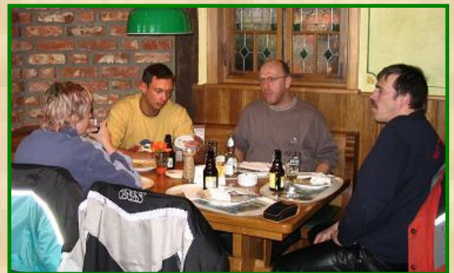
lecker Schnitzel mit Pott's

Rückweg über B475 nach Ennigerloh, Richtung Warendorf. Wetter wird schlechter, von Westen ziehen dunkle Regenwolken auf, daher hinter Westkirchen rechts über Beelen, Greffen, Halle-Westf., über Werther, Spenge zurück nach Hause.